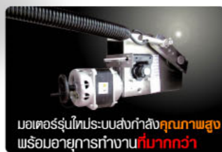
มอเตอร์รุ่นไฮเพอร์สปีดกำลัง คุณภาพสูง พร้อมอายุการทำงานที่ มากกว่า